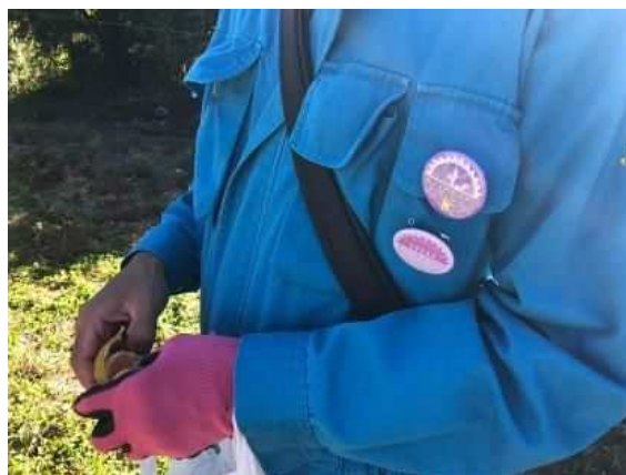
草刈り隊バッチ と 草刈りマイスターバッチ