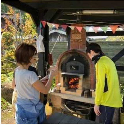
草刈り後のお楽しみ ①