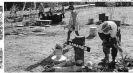
荒れ地再生 憩いの場に

多くの地域やコミュニティの共通課題となっている「草刈り」を通して交流を深めたいと企画しました。