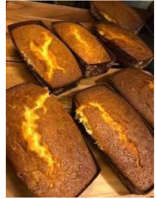
みんなで味わうお茶や昼食