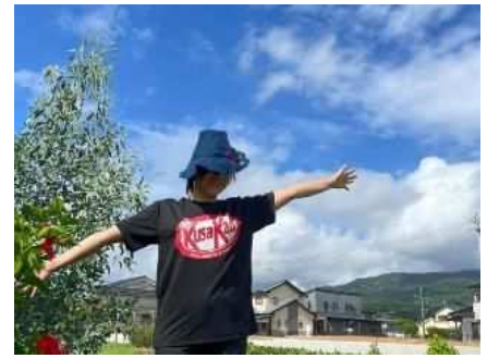
遊び心満載の 草刈り隊 Tシャツ