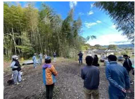
草刈り後のお楽しみ ② 出会いと体験