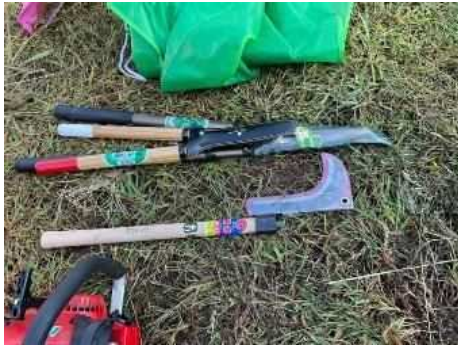
草刈り後のお楽しみ ③ 知識と技術の習得