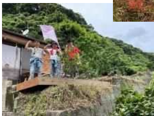
草刈り後のお楽しみ ④ 達成感と感謝の言葉