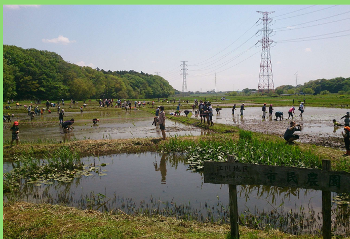
江川地区では、自然共生型農業に取り組んでいます